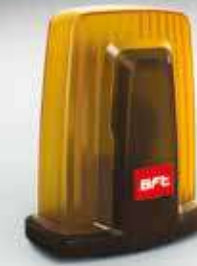
B-EBA TCP-IP e U-CONTROL