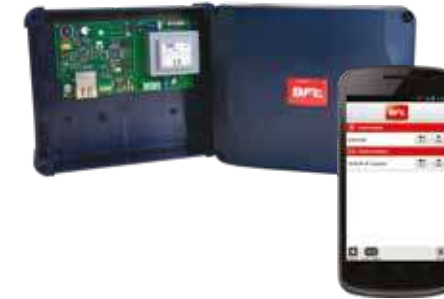
B-EBA TCP-IP e U-CONTROL